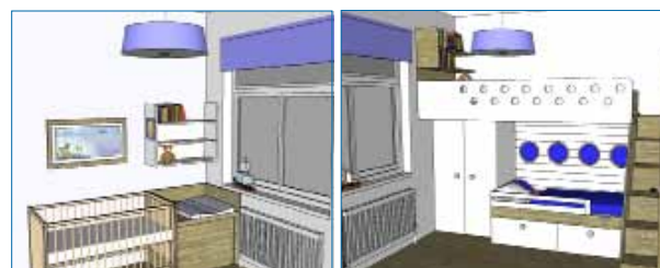
Finální návrh je zpracovaný pro dvě děti a zahrnuje i proměnu přebalovacího stolku v pracovní.

ře přespávají kamarádi, někdy i babička. Dlouhé horní lůžko je doplněno novodobou vestavěnou truhlou plnou plyšáků a políčkami na knihy. Pokojík se tenkrát stihl jen tak tak dokončit na podzim 2014 týden před porodem. Pomalu dozrává doba na plánovaná škatulata hejbejte se – přebalovák se změní v psací stolek, zpod něj zmizí rozměrný kontejner s hračkami. Holčička, budoucí prvňáčka, půjde do patra a dvouletý klouček na dolní postýlku.