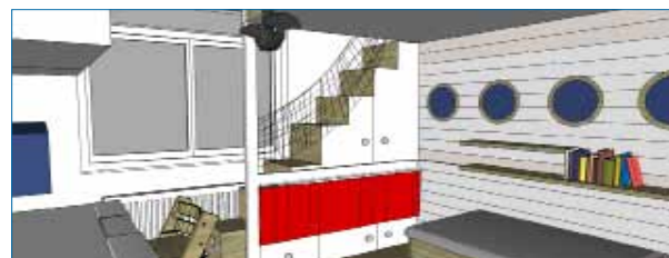
První verze počítala s jednou holčičkou a využitím původního spacího patra.