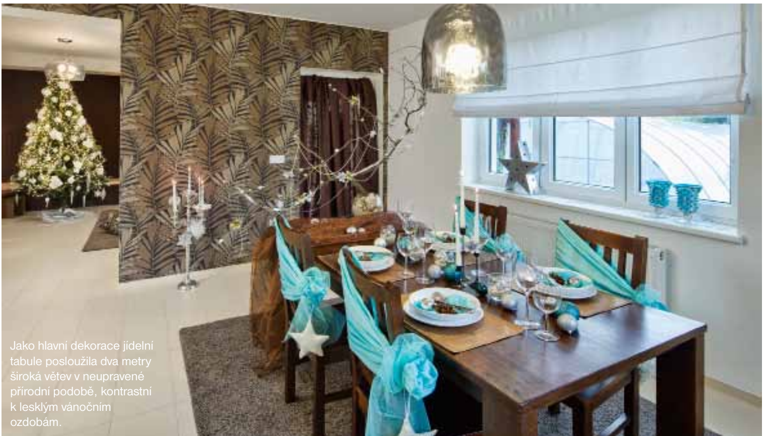
Jako hlavní dekorace jídelní tabule posloužila dva metry široká větev v neupravené přírodní podobě, kontrastní k lesklým vánočním ozdobám.

R odinný dům po patnácti letech užívání potřeboval určitý upgrade. Laminátové podlahy se ošoupaly a rozvzaly, dispozice s množstvím přiček přestala vyhovovat, do rodiny přibýly dvě děti, prostor potřeboval více otevřít a propojit.